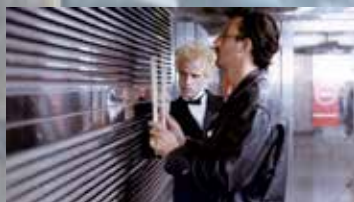
Metró (Luc Besson 1985)