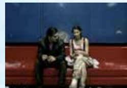
Kontroll (Antal Nimród, 2003)